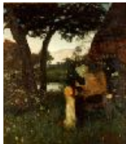
Die Märchenerzählerin, 1896

Nach einem Jahr gelang mit Hilfe vieler Förderer der Gesellschaft-Otto-Modersohn-Museum e.V. der Ankauf des Bildes